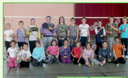
Un mercredi après-midi de badminton à la salle de Geudertheim

Il y a fort à parier que Geudertheim, associé à Hoerdt, deviendra bientôt un fief du badminton et que la Basse-Zorn fera voler en éclat les plumes des volants de la discipline. En effet, ce sont plus de 90 jeunes qui s'entraînent, à Hoerdt ou Geudertheim.