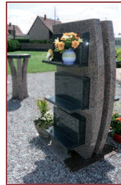
Exemple ici à Gamsheim

c'est l'entreprise MEAZZA de Mundolsheim qui effectuera les travaux pendant la période estivale, pour un coût de