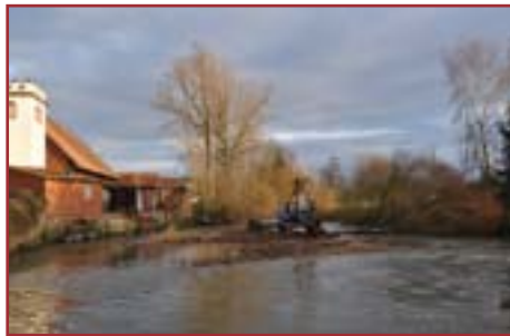
Îlot après arasement

L'enveloppe budgétaire allouée à ces opérations est d'environ 130 000 €, répartie au prorata du linéaire de berge de chaque commune. Les travaux éligibles aux aides seront subventionnés à hauteur de 80% par le Conseil Général du Bas-Rhin et l'Agence de l'Eau Rhin-Meuse.