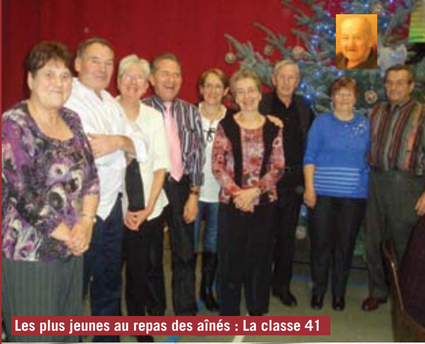
Les plus jeunes au repas des aînés : La classe 41