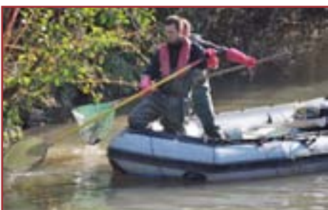
Perche électrique et épuisette

Afin d'avoir une connaissance précise du nombre d'espèces de poissons et de la population de chacune d'entre elles dans la Zorn, le conseil général a commandé plusieurs pêches électriques en divers endroits du bassin versant de cette rivière. Ces pêches sont réalisées par la fédération départementale de pêche du Bas-Rhin. L'une d'entre elles a eu lieu le 4 octobre au niveau du pont enjambant la Zorn entre Hoerdt et Bietlenheim. Un groupe électrogène embarqué sur un zodiac avec trois personnes à bord fournit à deux électrodes un courant de faible intensité sous une tension allant de 300 à 600 volts, selon la température et la conductivité électrique