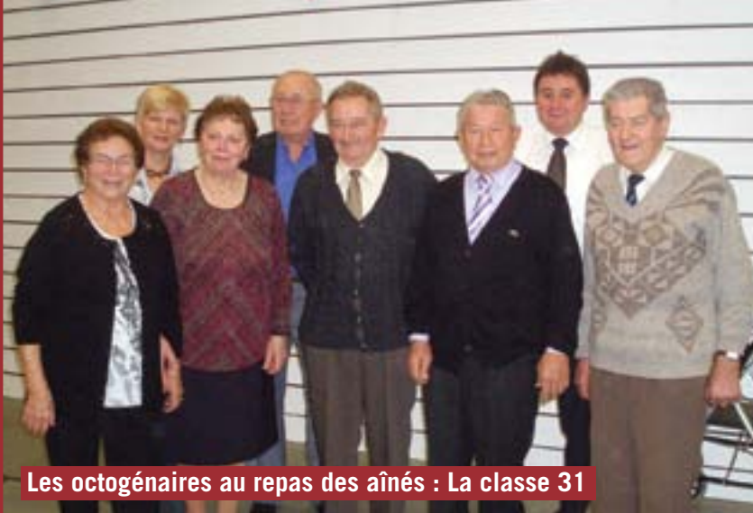
Les octogénaires au repas des aînés : La classe 31