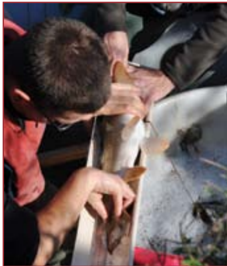
Mesure de la longueur d'un barbeau

de l'eau. L'une des électrodes se présente sous la forme d'une perche tenue par l'une des trois personnes et terminée par un treillis métallique circulaire. Lorsque cette perche est plongée dans l'eau, il se produit autour un champ électrique d'environ 2 m de diamètre qui choque les poissons qui y sont présents. Étourdis, ils se laissent remonter entre deux eaux ou en surface. Une deuxième personne les ramasse alors avec une épuisette et les met dans un bac rempli d'eau, dans laquelle on insuffle de l'oxygène, à bord du zodiac. L'équipe a procédé ainsi à des captures environ tous les 10 m sur chaque berge de la Zorn, sur une longueur approximative de 400 m, la troisième personne pilotant le canot d'un point à un autre. Une fois la pêche terminée, les plus gros poissons sont comptabilisés par espèces, mesurés puis immédiatement relâchés. Les plus petits sont amenés sur berge, triés par espèce, chacune dans un seau d'eau, puis comptés et relâchés. Pendant cette opération, une autre équipe mesurait environ tous les 10 m la profondeur de l'eau au niveau des berges et au milieu du lit de la rivière. Les résultats de ces pêches seront connus début 2012.