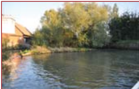
Îlot avant arasement

Les communes riveraines de Bietlenheim, Geudertheim et Hoerdth ont décidé d'engager ensemble, dans le cadre du SIVU créé en 2010, un premier programme de travaux de restauration de la végétation et des berges. Le linéaire concerné représente environ 4,5 km de cours d'eau. Le bureau d'études SOGREA-ARTELIA a été choisi pour assurer la maîtrise d'œuvre de ce programme.