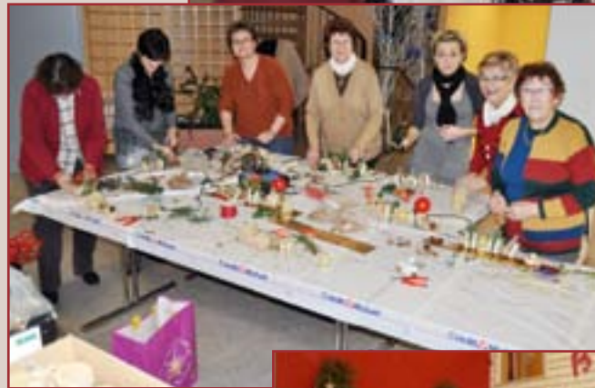
Une partie de l'équipe de bénévoles en pleine action pour la préparation de la salle