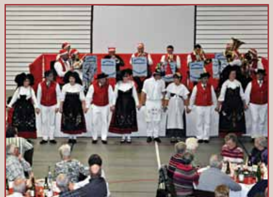
Musique paysanne et groupe folklorique