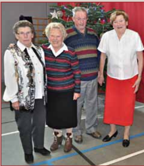
Les personnes qui ont eu 80 ans cette année

Ils sont venus pour la 1 ère fois, bravo ! (les personnes âgées de 70 ans)