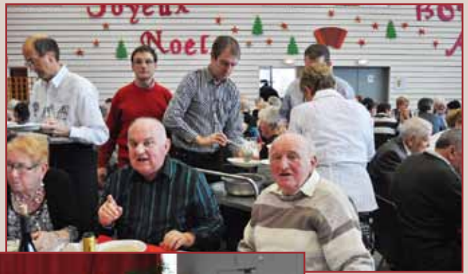
Le service en action

Le boucher traiteur GROSS et une partie de son équipe ont régala nos séniors. La journée a été animée par la musique paysanne et le groupe folklorique de Geudertheim, avec toujours des étoiles plein les yeux de leur voyage à Shanghaï. Les convives ont d'ailleurs pu voir défiler le film de ce séjour sur grand écran. Ils n'ont pas été déçus par la prestation des danseurs, d'autant moins que le maire et une de ses adjointe, anciens membres du groupe, se sont joints à eux pour présenter quelques danses de leur répertoire.