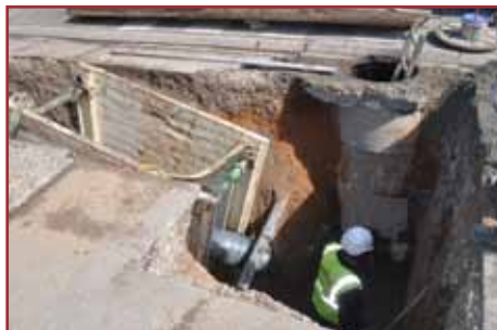
Construction du déversoir

Dans le cadre de la lutte contre les coulées d'eau boueuse et pour éviter l'engorgement des canalisations d'eaux usées en cas de violents orages, avec pour conséquence