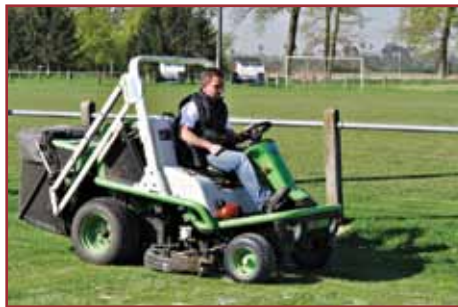
Tonte du terrain

800 €. Au printemps et à l'automne, l'entreprise CSE-Est de Duppigheim procède à l'aération des terrains à l'aide d'aérateurs à louchets (grosses pointes s'enfonçant dans le sol), à l'émiettement des parties dures, aux semis de regarnissage et à l'application d'engrais, le tout pour un coût annuel de 8 000 €. Sablage et aération ont été réalisés conjointement fin avril dernier. Les terrains sont tondues une fois par semaine, ce qui demande une journée de travail à un ouvrier communal. Enfin, même si vous ne l'avez pas