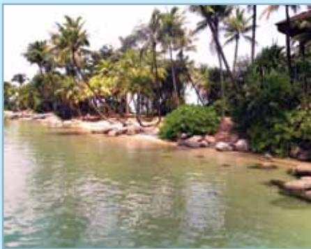
Île Sentosa à Singapour

Je suis partie avec deux valises que j'ai mis quelques semaines à défaire car j'ai eu un coup de panique quand je suis arrivée là-bas : « Oh mon Dieu ! Je suis à 10 000 km de tous les gens que je connais ! »