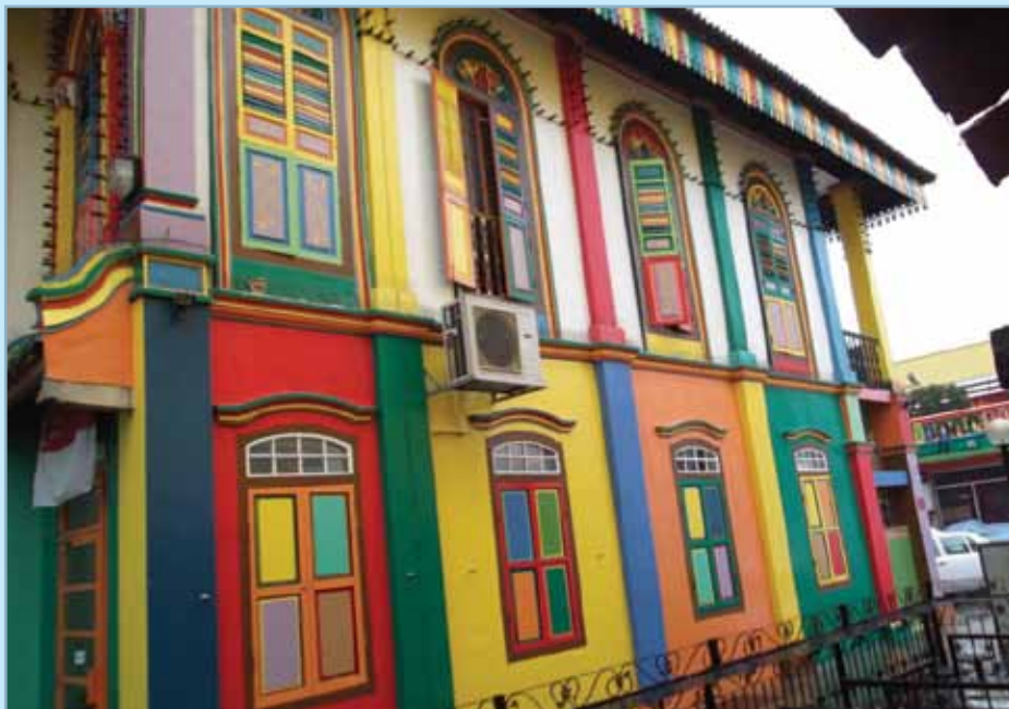
Quartier indien «Little India»

Je suis allée à Singapour de 2001 à 2005 pour le groupe Mulliez (Pimkie et Orsay) en charge du bureau d'achat de vêtements sur la zone Singapour, Malaisie, Cambodge, Vietnam, Indonésie. J'étais également en charge de la création et de l'ouverture d'un bureau d'achat en Inde pour les marques Orsay et Pimkie.