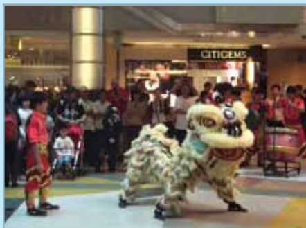
Full moon festival (Festival de la pleine lune)

séjour. Développer un bureau : recruter des collaborateurs locaux, faire face aux administrations locales etc. En 2003, le SRAS (Syndrome Respiratoire Aigu Sévère) est apparu à Singapour : mise en quarantaine de malades, port de masques, on évitait de sortir, on vivait dans la peur, la télévision locale annonçait le nombre de personnes décédées chaque jour. D'autant plus que j'étais enceinte de Rafael cette année-là.