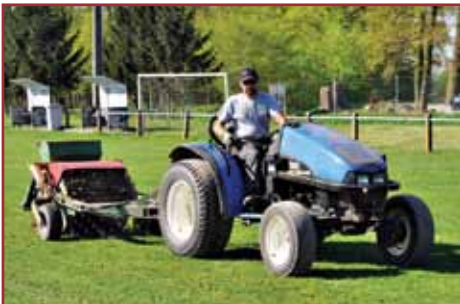
Aération du terrain

Afin qu'ils demeurent toujours praticables, les trois terrains du stade de foot sont l'objet de soins constants. Tous les deux ans, les ouvriers communaux épandent 60 tonnes de sable à l'aide d'une machine prêtée par la commune de Hoerd, pour un montant de