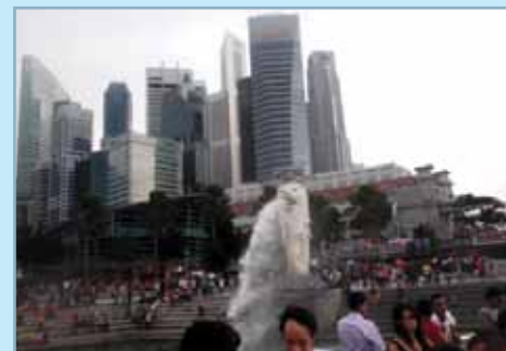
Quartier d'affaires (au fond) et le merlion (sorte de lion, au premier plan), symbole de Singapour.

Je suis contente d'avoir vécu dans un cadre et une culture totalement différente.