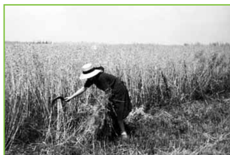
Le blé est mis en gerbe avec l'aide d'une faucille (Photo tirée du livre Geudertheim, le grenier aux images )

(Photo tirée du livre Geudertheim, le grenier aux images )