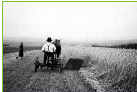
Fauchage du blé avant la mise en gerbes, il y a bien longtemps.

Wie's nit meijli gewan esch, àlli Frucht àm salwe Deuij ze dresche, sen d'Gorwe en de Schiere stockert wore un em Spotjohr d'heem gedresche wore. Mer het veel Arm muen hon, fer d'Gorwe vum Vertel uf Dresch-Màschin ze warfe un uf de eunder Sitt d'Freucht en Saeck ze benge, un de uf'm Buckel uf d'Kàscht en d'Freucht-Kàmmer ze treuije. Des àlles em'a Steuib-Wolicke.