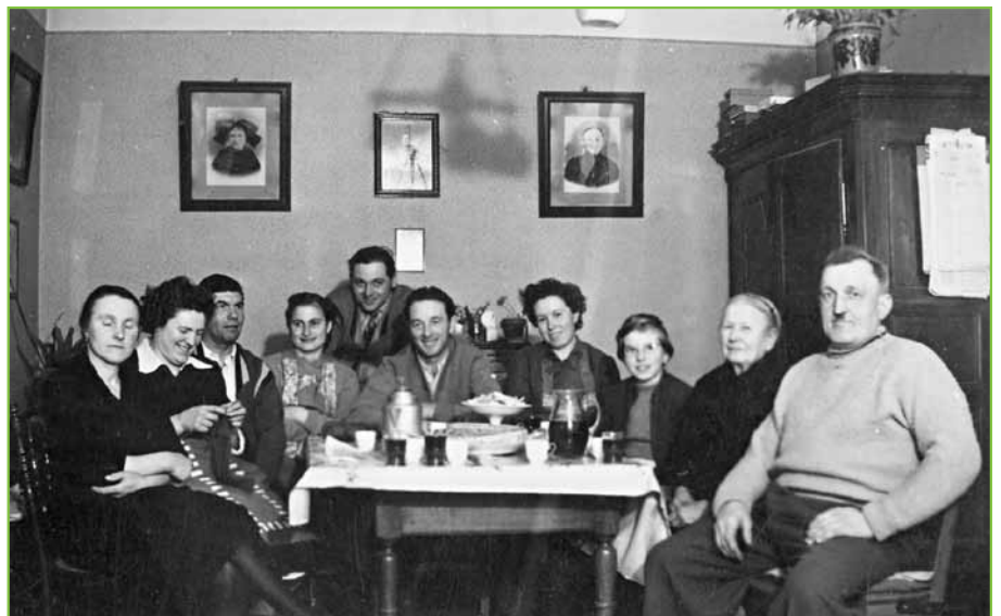
Streckstüb chez les Hamm (Herde-Beckel)

Bemerikung: em de elsassisch Rübrik vom Internet-Site vun de Gemeen Geyderthe wurd jede Monet ebbs Neuij's züg'setzt. Mer fengt u.à. Kochrezapter, Büreregle. Enger «gescht un hit» esch zuem Beispeel a Artikel ewer a Wiehnoochts-Owe vum Johr 1915 ze lase.