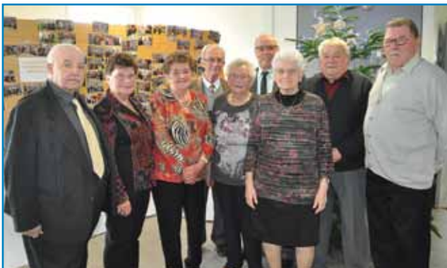
La classe 1935