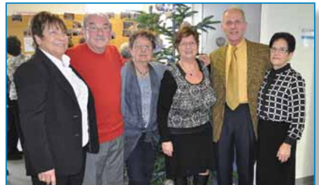
La classe 1945

Le 20 décembre dernier, 4 e dimanche de l'Avent, a été celui du traditionnel repas des seniors, précédé d'un office œcuménique,