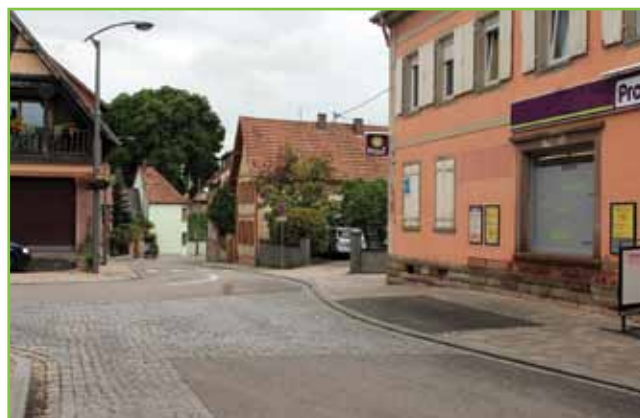
De Becke-Bari met racht's de jetzi Proxi, d'àlt Beckerei vum Kaller's Beck. Le Becke-Bari avec à droite l'actuel Proxi, ancienne boulangerie.

(*) D'autres informations sur les monts de Geudertheim se trouvent dans la rubrique dialectale du site officiel de Geudertheim.