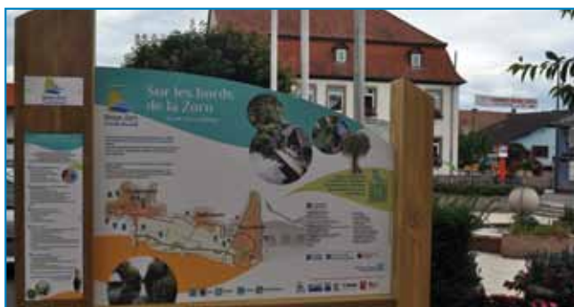
Panneau implanté place Marie-Georges Picquart