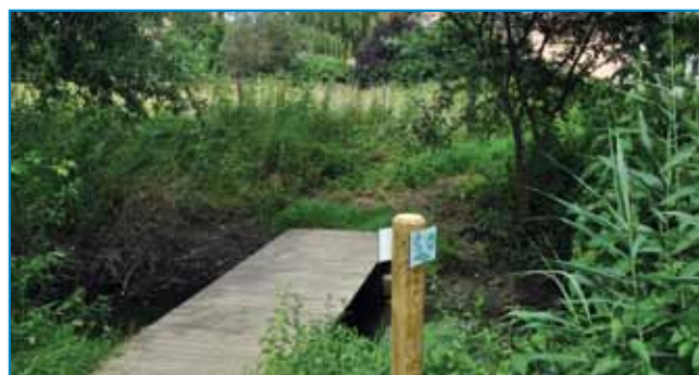
Nouvelle passerelle financée par la CCBZ.

Après le parcours Ludisme et équilibre vital inauguré en septembre 2011, voici que quatre circuits pédestres et un circuit VTC ont vu le jour après cinq années de réflexion et de travail. Ces circuits « découverte » ont été conçus et réalisés par la commission Culture et Tourisme de la communauté de communes de la Basse-Zorn (CCBZ). Ils mettent en valeur les richesses naturelles et patrimoniales du territoire de la Basse-Zorn. Ils sont tous balisés, les promeneurs ne peuvent pas se perdre. Les points importants sont indiqués soit par des panneaux