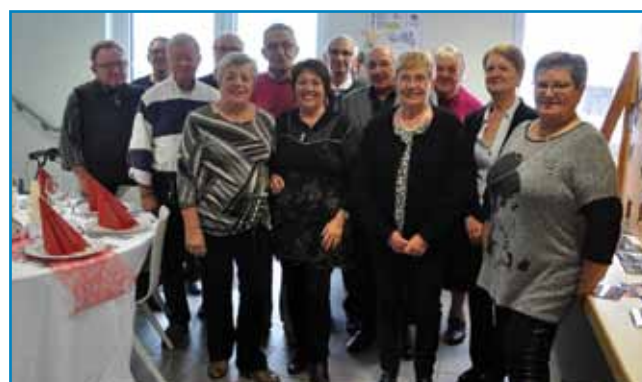
La classe 1947

Comme le veut la tradition, le repas de Noël des seniors a eu lieu le 10 décembre dernier. Près de 190 personnes ont répondu à notre invitation et se sont retrouvées dans la salle du Waldeck harmonieusement décorée aux couleurs de Noël par des membres du CCAS et quelques bénévoles.