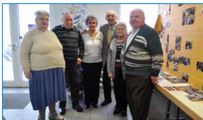
La classe 1937