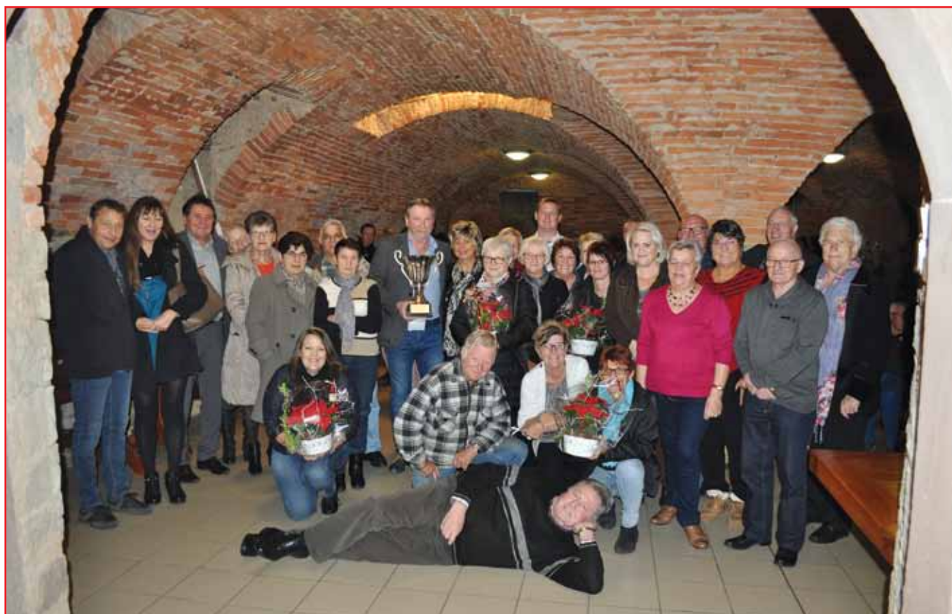
Remise des prix 2017

Depuis 25 ans notre commune récompense les habitants qui se mobilisent au quotidien pour embellir notre village. Le fleurissement des maisons est devenu une belle tradition que la municipalité souhaite encourager et dynamiser.