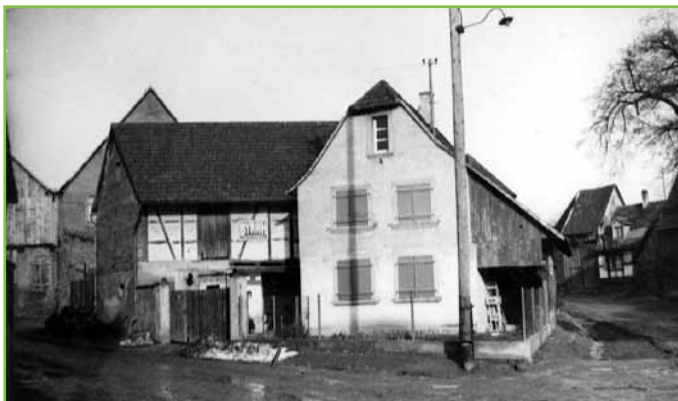
Aufdeuijung em a Winter von de Johre 1950 à de Krizung vum Heile-Hiesel un d'Beetler Stross. Noch ken Teer oder macadam, àwer Kess un Bab.

Dégel d'un hiver des années 1950 au croisement de la rue Sainte Maison et de la route de Bietlenheim. Pas encore de goudron ou de macadam mais une chaussée avec du gravier et donc boueuse.