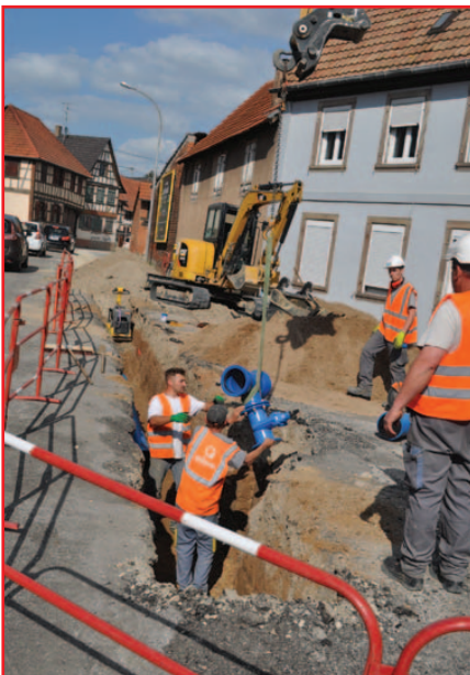
Pose d'un « T » de raccordement avec vanne

Jeudi 11 octobre, la société Rosace a diligenté la pose du génie civil pour les deux SRO (Sous-Répartiteur Optique) prévus pour le déploiement de la fibre, l'un au niveau de l'impasse Jacques et l'autre en face du restaurant Au Cygne .