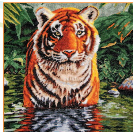
Le bain du tigre : temps passé 380 h environ, 45 cm x 50 cm

Reproduire des modèles avec du fil est passionnant. J'aime les couleurs, le tissu, les perles... Ce que je préfère broder, ce sont des portraits de femmes. Je trouve le rendu extraordinaire. Parfois, lors d'expositions, les visiteurs trouvent que je réalise « de belles peintures », mais lorsqu'ils s'approchent et