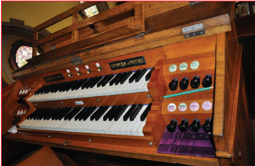
La console rénovée

accouplements et tirasses. Des tubes en plomb, reliant la tirasse au bloc de membranes, ont étonnement été coupés et condamnés. Ils ont été remplacés par des tubes en copie. Cela était indispensable pour restituer les notes de tirasse qui n'étaient pas fonctionnelles.