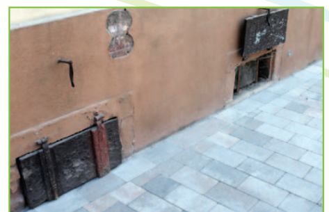
Derrière ces soupiraux, une cave à vin plus que centenaire.

Les Américains, stationnés à cette époque dans le village, raffolaient de toutes ces bonnes choses, en particulier du vin, du schnaps et de la confiture de quetsches qu'ils mangeaient avec... la choucroute ! En échange de chocolat, chewing-gums et boîtes de corned-beef.