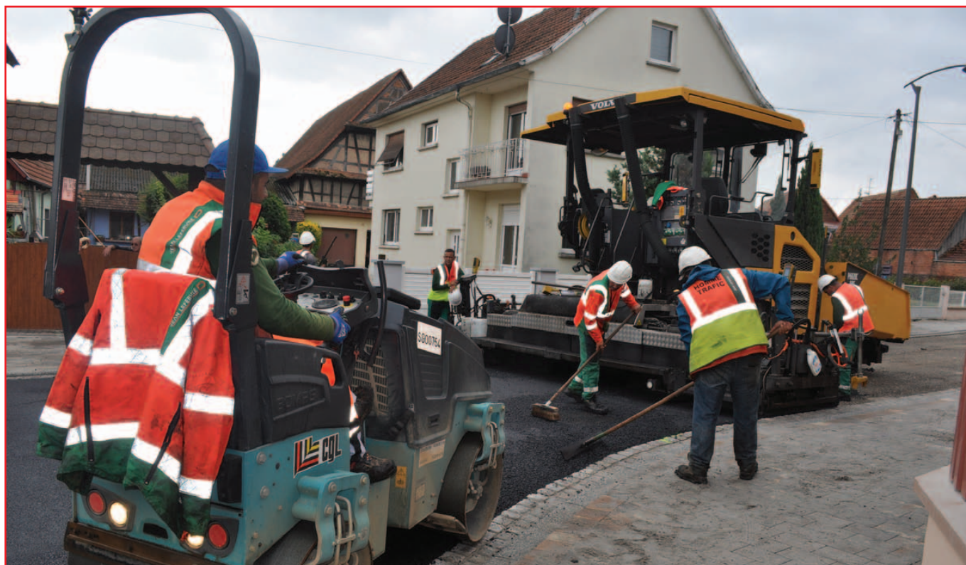
Pose de l'enrobé du 1 er tronçon

Après la branche sud de la rue du Général de Gaulle en 2011, puis la route de Bietlenheim en 2014, c'est au tour de la branche ouest de la rue du Général de Gaulle d'être rénovée cette année. Ce chantier, le plus long et le plus complexe des trois, achèvera la restructuration des trois axes principaux du village.