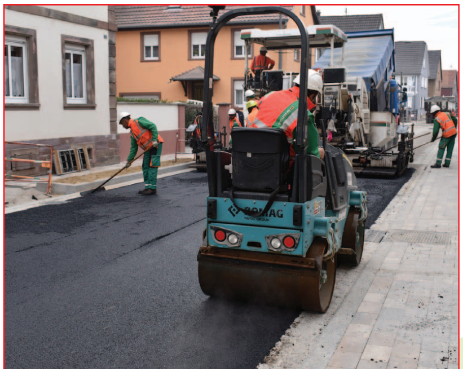
Pose de l'enrobé du 2 e tronçon

Il faut relever le comportement louable de la majorité des riverains qui, malgré les nuisances et nuages de poussières favorisés par le temps estival, ont pris leur mal en patience. Ils seront bientôt récompensés en disposant d'une infrastructure toute neuve et de beaux trottoirs où il fera bon déambuler en toute sécurité.