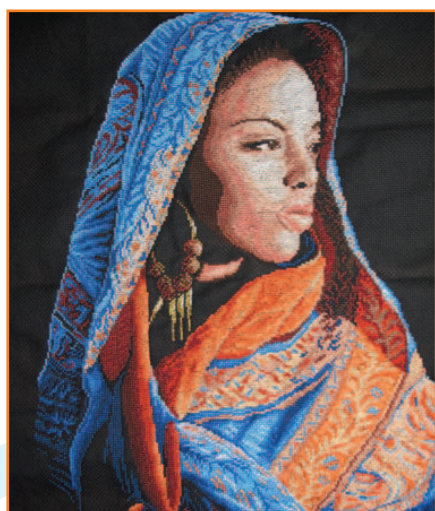
Femme africaine : temps passé 210 h environ, 32 cm x 48 cm

Continuer la broderie bien sûr, mais également essayer de donner une part plus importante à mes autres passions comme l'Égypte ancienne. Depuis trois ans je suis des cours d'égyptologie à l'université de Strasbourg et j'apprends à déchiffrer les hiéroglyphes. Lorsque j'ai un peu de temps j'aime aussi écrire, et je suis également férue de lecture.