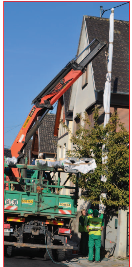
Pose d'un mat

pour qu'ils puissent travailler en toute sécurité. Est-ce là notre société ? Où va-t-elle ?