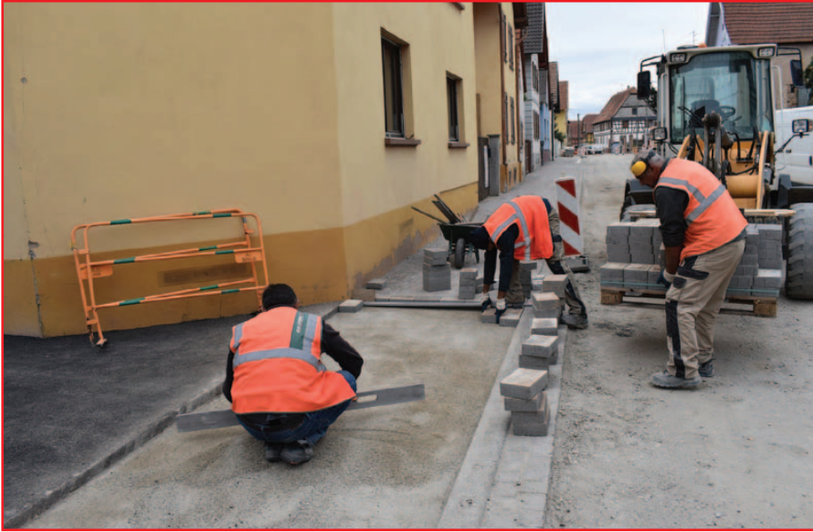
Pose des pavés du 2 e tronçon