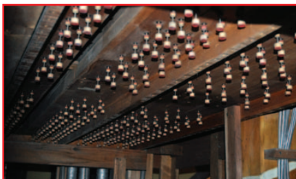
Sommiers et soufflets

Dans le soubassement de l'orgue, où sont placés les sommiers et les relais, pas moins de 600 petits soufflets cylindriques ont été changés. Composés de deux tables cylindriques et d'une peau très fine