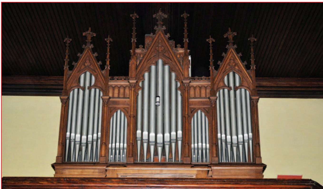
L'orgue LINK de l'église S t Blaise

de la paroisse catholique de Geudertheim