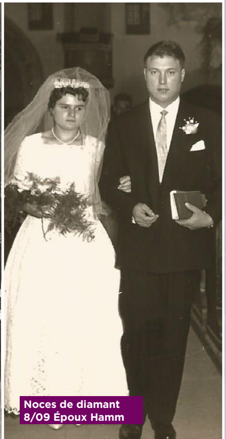
Noces de diamant 8/09 Époux Hamm