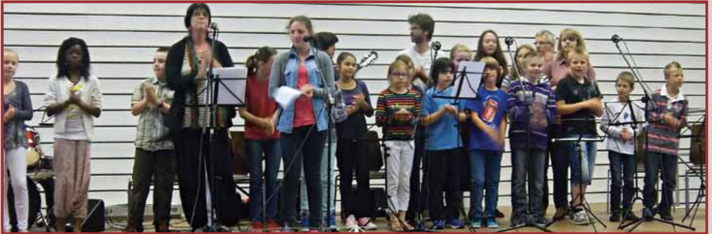
Chœur : Tout le monde s'y met, y compris les professeurs.

L'école de musique municipale a pour vocation d'enseigner toutes formes de musiques et différentes pratiques instrumentales à des élèves de tous âges. Toutes les informations concernant ses enseignements sont disponibles sur le site communal www.geudertheim.fr sous la rubrique « Culture et Loisirs/École de musique ».