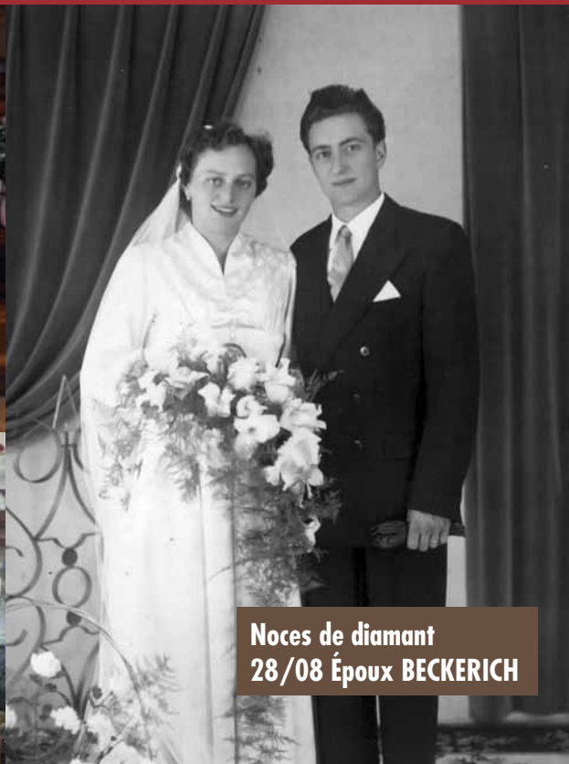
Noces de diamant 28/08 Époux BECKERICH