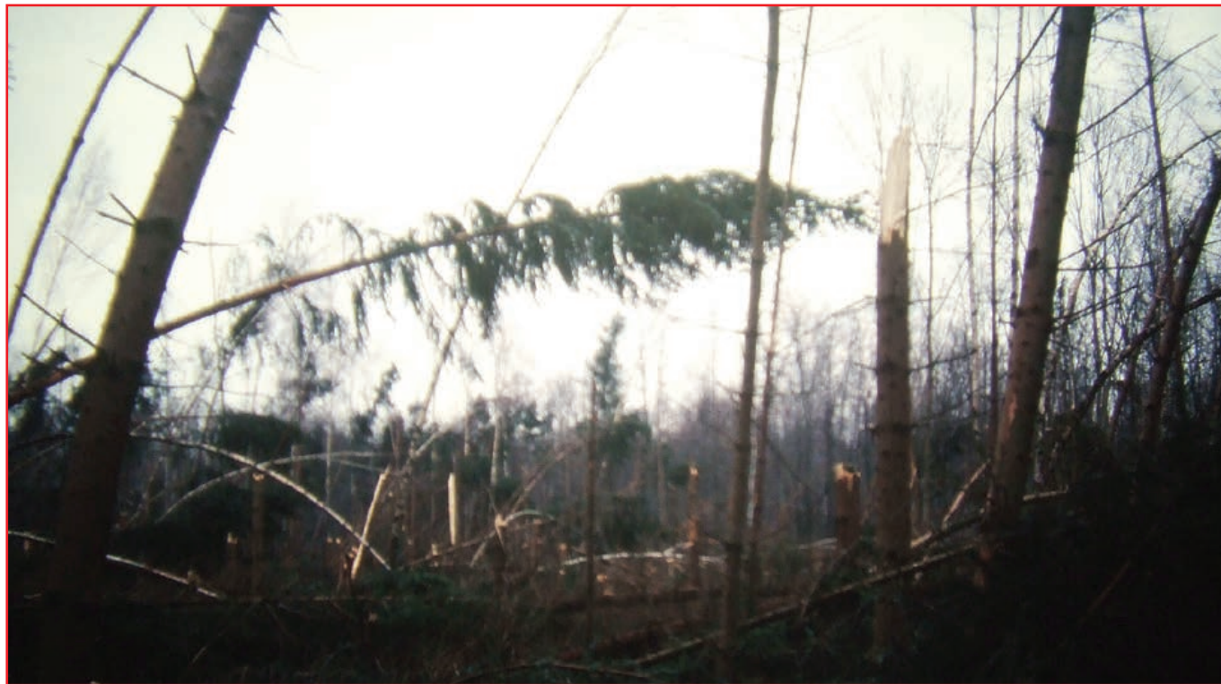
La forêt de Geudertheim après Lothar

En 1999, un hôte indésirable a traversé la France et l'Alsace, détruisant tout sur son passage et semant le chaos. Vingt ans après, on a retrouvé son journal de bord où il évoque son forfait, n'hésitant pas à s'en « venter ». Ses notes sont retranscrites ci-après.