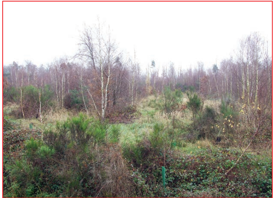
Régénération naturelle et plantations en 2010

pionnières et à forte croissance juvénile, sont apparus très vite, et il faudra s'en occuper encore longtemps, car ils représentent le court et le moyen terme économique à condition de les éduquer et calmer leur ardeur colonisatrice.