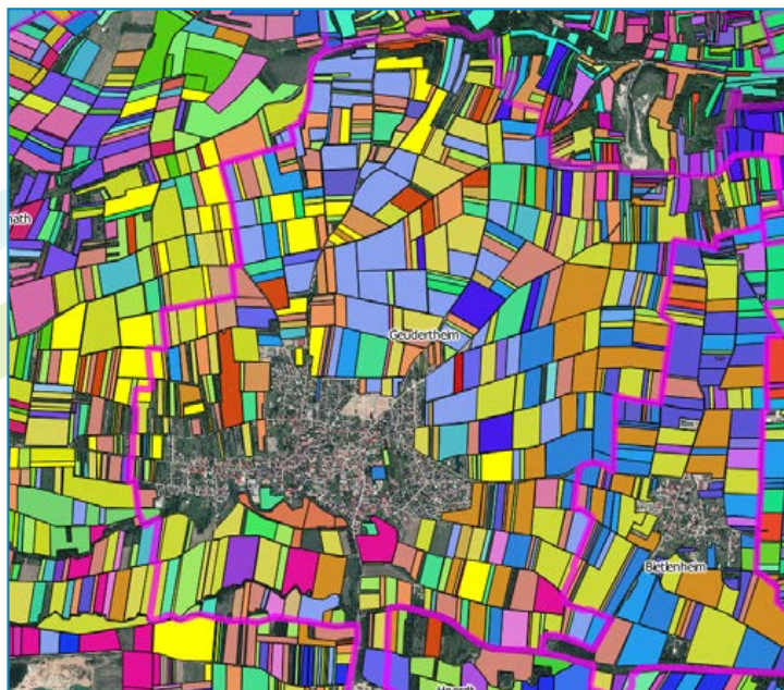
Carte des exploitants agricoles de Geudertheim

émises lors de cette consultation font l'objet d'un examen par la commission intercommunale d'aménagement foncier qui peut, le cas échéant, aboutir à une modification du plan de classement. Le cabinet de géomètres-experts a commencé en novembre 2019 à procéder à la phase dite de « réception des vœux », qui consiste à recueillir les souhaits des différents propriétaires et agriculteurs situés à l'intérieur du périmètre des opérations en vue de l'élaboration du plan du nouveau parcellaire. L'année 2020 sera essentiellement consacrée à l'élaboration de l'avant-projet puis du projet de nouveau parcellaire de l'aménagement foncier ; ce travail est mené en concertation avec les propriétaires, les exploitants agricoles, les commissions d'aménagement foncier, les communes, le bureau d'études en charge de l'étude d'impact environnemental.