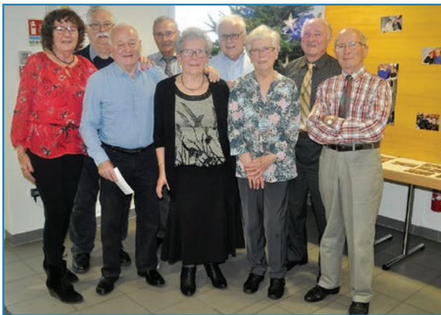
La classe 1939