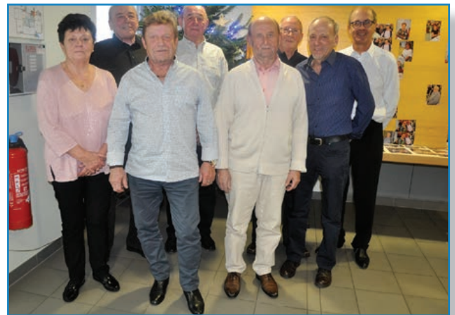
La classe 1949