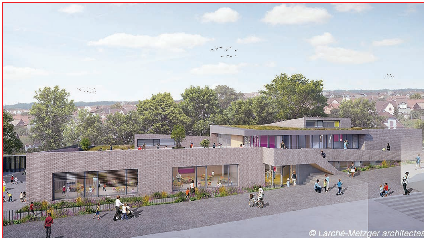
Les salles de classes en RC, le périscolaire et sa cour en terrasse à l'étage

Pour répondre aux besoins générés par l'accroissement des effectifs scolaires, la commune a décidé d'engager un concours de maîtrise d'œuvre pour la construction d'une nouvelle école maternelle comprenant 4 classes en maternelle (2 classes « petits », 1 classe « moyens » et 1 classe « grands », environ 660 m 2 ), un périscolaire pour les écoliers de 3 à 6 ans (80 repas par jour en moyenne, environ 301 m 2 ) et l'aménagement d'espaces extérieurs (cour, préau, dépose minute, parking, espaces de circulation, sur une surface de 815 m 2 ).