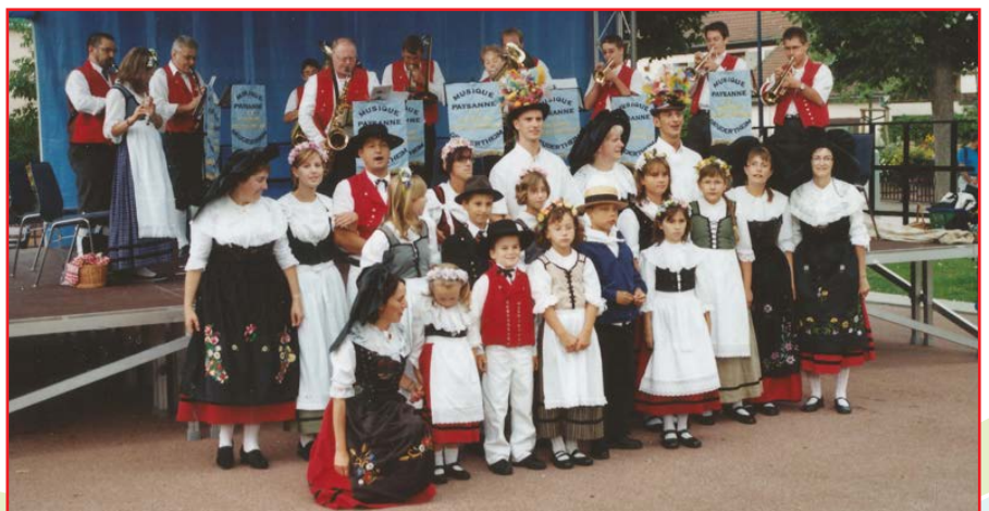
Les folkloristes dans le parc du casino de Niederbronn (2009)

À Limoges, un dimanche matin, au départ d'un grand défilé, le premier coup de grosse caisse retentit... et fait un trou dans la grosse caisse !