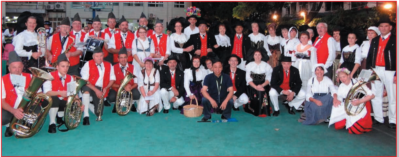
La Musique Paysanne et le Groupe Folklorique au 23 e festival international du tourisme à Shanghai (2012)

Jacques Roser, ancien soldat de la Grande Armée, crée la Musique Paysanne de Geudertheim en 1836, certainement la plus ancienne société de musique de la région, dotée de son groupe folklorique autour de 1900. Ses activités sont à l'arrêt depuis 15 mois : elle n'a pas pu célébrer son 185 e anniversaire lors du concert qu'elle aurait donné en mars, ni se produire lors de ses prestations dont voici une présentation.