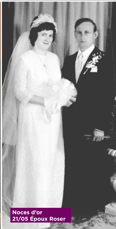
Noces d'or 21/05 Époux Roser