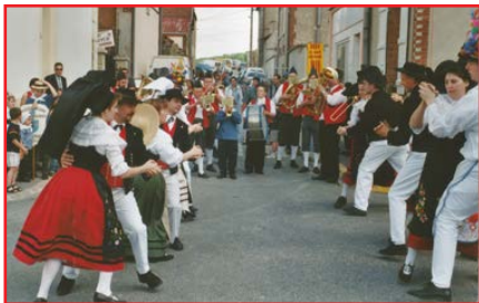
L'association s'est produite dans la Marne (2002)

Limoges (années 1970), Orgeval dans les Yvelines (1982), Vignot dans la Meuse (1984), Tourouvre dans l'Orne (1994), Amiens (1998), Dreux (1999), Châlons-en-Champagne (2000), Giens dans le Loiret (2002), Sausset-Pins dans les Bouches du Rhône (2002), Auzances dans le Limousin (2005), Vichy (2009), Villemomble en Seine-Saint-Denis (2011), Janville en Eure-et-Loir (2014).