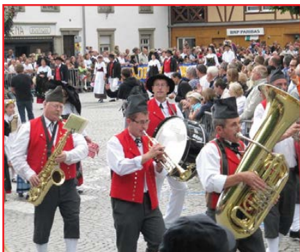
Le défilé dans les rues à Benfeld (2010)

Un moment marquant a été la commémoration du 60 e anniversaire de l'armistice, le 11 novembre 1978 dans la clairière de Rethondes près de Compiègne, où les membres ont attendu Valéry Giscard d'Estaing dans un froid glacial pendant quelques heures. Ils ont pu serrer la main du président de la République. « C'est un souvenir inoubliable pour des enfants », d'après Cathy Hilbold (fille de René), 10 ans à l'époque.