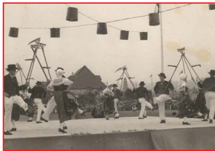
La danse des moissonneurs est exécutée à Obernai (1950)

se tenaient derrière les barrières de sécurité sur une grande avenue. « On avait l'impression de défiler sur les Champs-Élysées, et c'était même plus grand », selon les musiciens et folkloristes.